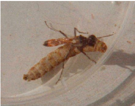
Eine Sandwespe mit ihrer Beute