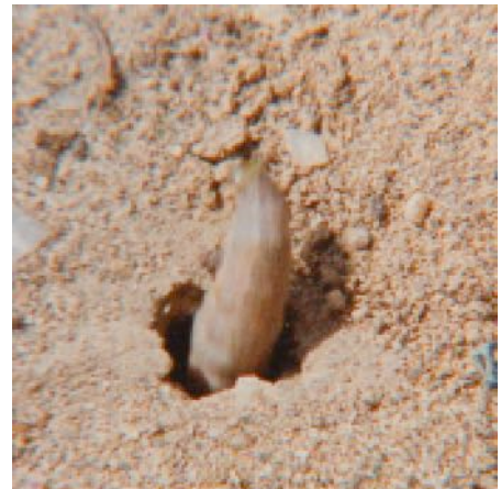
Die Beute wird in das Nest gezogen