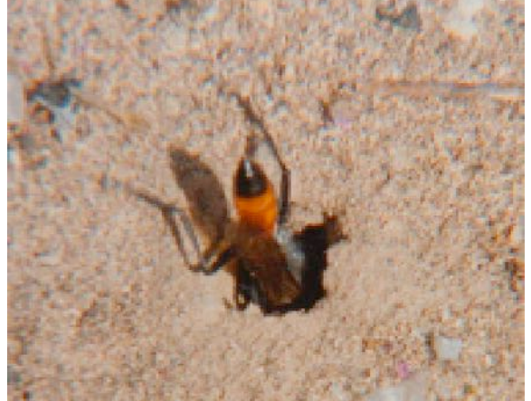
Die Sandwespe schlüpft zur Inspektion in ihr Nest