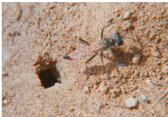
Die Wespe scharrt Sand in die Nestöffnung