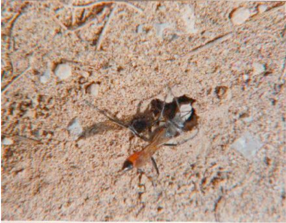
Eine Sandwespe bei der Arbeit an ihrem Nest: Verschließen mit einem Steinchen